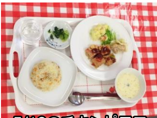
5/18のチキンピラフとミートローフ