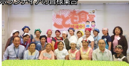
ボランティアの皆様集合