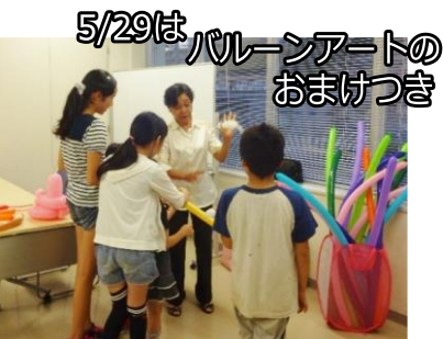
5/29は、バルーンアートのおまけつき