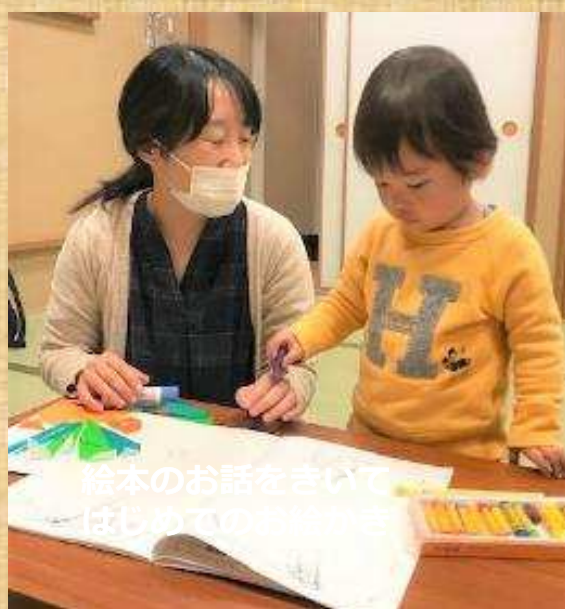
絵本のお話をきいてはしめるの