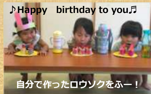
♪Happy birthday to you♪