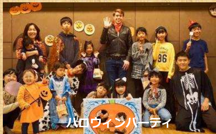
ハロウィンパーティ