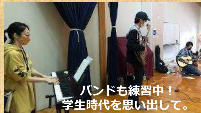
バンドも練習中! 学生時代を思い出して。

私たちだっくの会は、現在、世界の物語にふれながら、劇表現で英語を自然に学び、アメリカ、カナダ、ニュージーランドなどとの交換ホームステイプログラムを持つラボ英語教室の子どもたち（幼児、小中高大生）を我が子に持ち、共に活動しているサークルです。シーズンごとの交流会、海外からの学生とのイベント、親子キャンプの他にバンド演奏や英語の歌なども軽く楽しんでいます。グローバルな子育てを家族で楽しみたい方、仲間になりませんか。