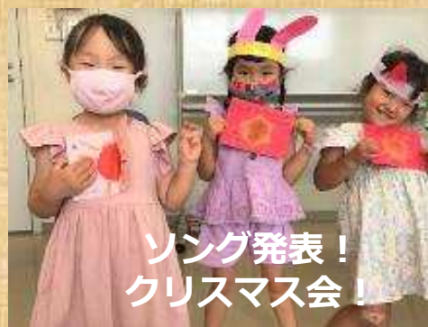
ソング発表！ クリスマス会！