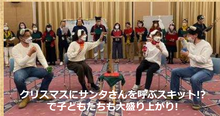
クリスマスにサンタさんと呼ぶスキット!? で子どもたちも大盛り上がり!