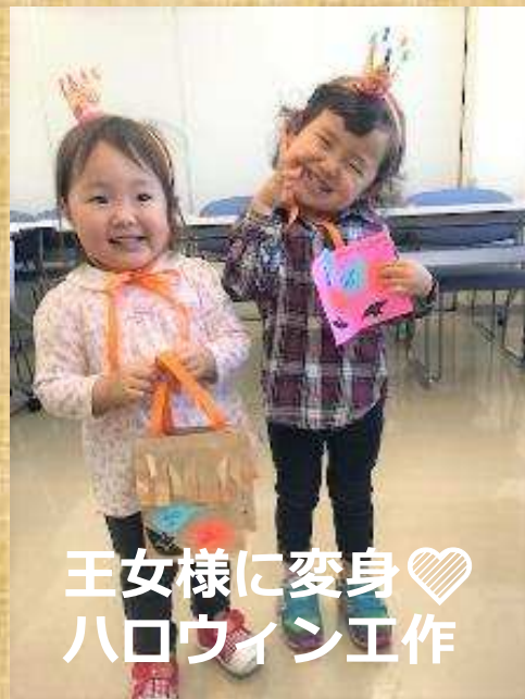
王女様に変身♡ ハロウィン工作