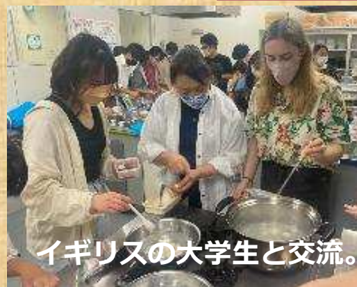
イギリスの大学生と交流。