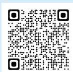
東海道川崎宿 交流館