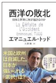
エマニュエル・ドット