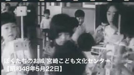
ほくたちのお城 宮崎こども文化センター 【昭和48年5月22日】