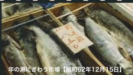
年の瀬にぎわう市場【昭和62年12月15日】