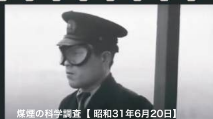
煤煙の科学調査【昭和31年6月20日】