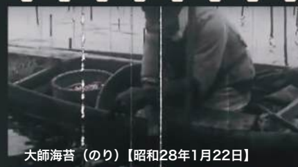
大師海苔（のり）【昭和28年1月22日】