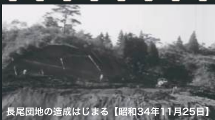
長尾団地の造成はじまる【昭和34年11月25日】